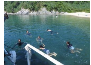
透明度15mの海でシュノーケリング

僕たちと人間が仲良く暮らせるシステムを作る新しい取り組みが始まっているよ。僕たちに会いに来たり、マリンレジャーを楽しんだり、海や山の資源を有効に活用して地域活性化に役立てる試みだよ。