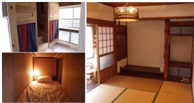
上関まるごと博物館

僕たちと人間が仲良く暮らせるシステムを作る新しい取り組みが始まっているよ。僕たちに会いに来たり、マリンレジャーを楽しんだり、海や山の資源を有効に活用して地域活性化に役立てる試みだよ。